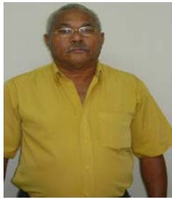
SUPERVISOR DE SEGURANÇA