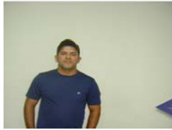
FISCAIS AGENTES PENITENCIARIOS