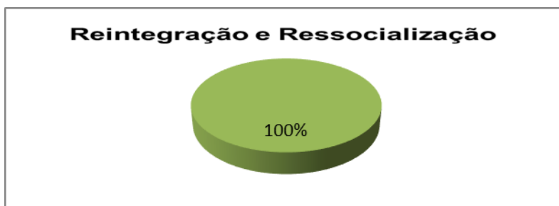
Gráfico 2: O Convênio na Visão dos Reeducandos Penitenciários

Entre os reeducandos, 100% reconhecem que o convênio CASAL/SERIS é uma porta para que eles sejam reingressados ao mercado de trabalho, para a ressocialização e para refletir que não vale praticar atos errados, conforme gráfico 2: