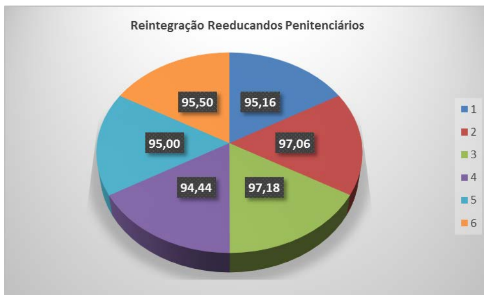
Gráfico 3: Reintegração Reeducandos Penitenciários